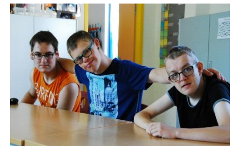
Konzept der Arbeit, 01/20